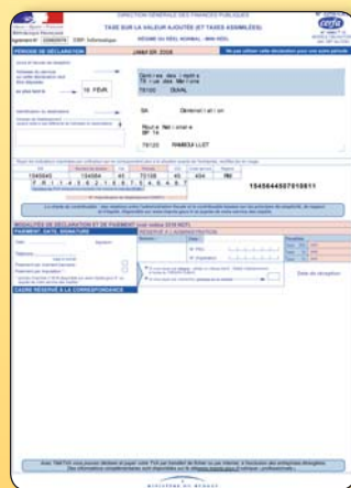
Avec EBP Compta Classic, établissez votre déclaration de TVA