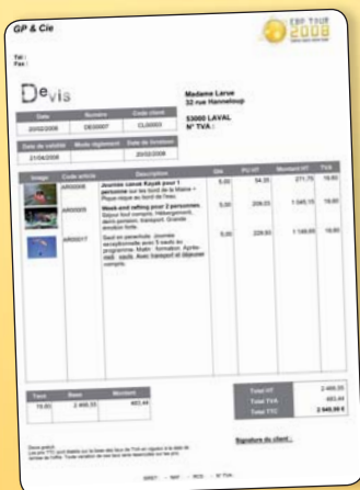
Avec EBP Gestion Commerciale Classic, personnalisez vos factures (logo, images,...)