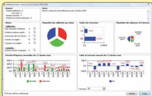
Le tableau de bord vous donne les indications clés pour gérer l'essentiel de votre association.

Enfin, 5 graphiques sont à votre disposition, vous permettant de visualiser instantanément les informations clés de votre association comme l'évolution de vos recettes et dépenses sur les 12 derniers mois, le solde des postes de trésorerie ou encore la répartition de vos dépenses pour l'exercice.