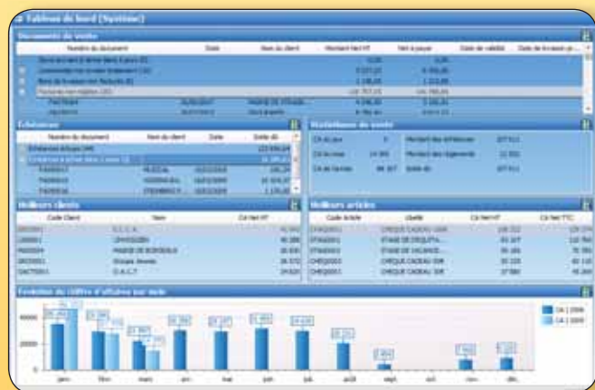
L'un de vos tableaux de bord