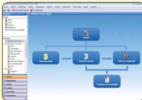
Une nouvelle ergonomie intuitive

Elle permet aussi d'effectuer une recherche multicritères, comme un nom et un montant. Cette recherche intelligente est disponible à tout moment, quelle que soit la fenêtre du logiciel.